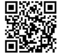
QR code ระบบจองเครื่องมือฯ

*พร้อมแบบหลักฐานการโอน ส่งกลับมาก็ e-mail: centrallab@msu.ac.th