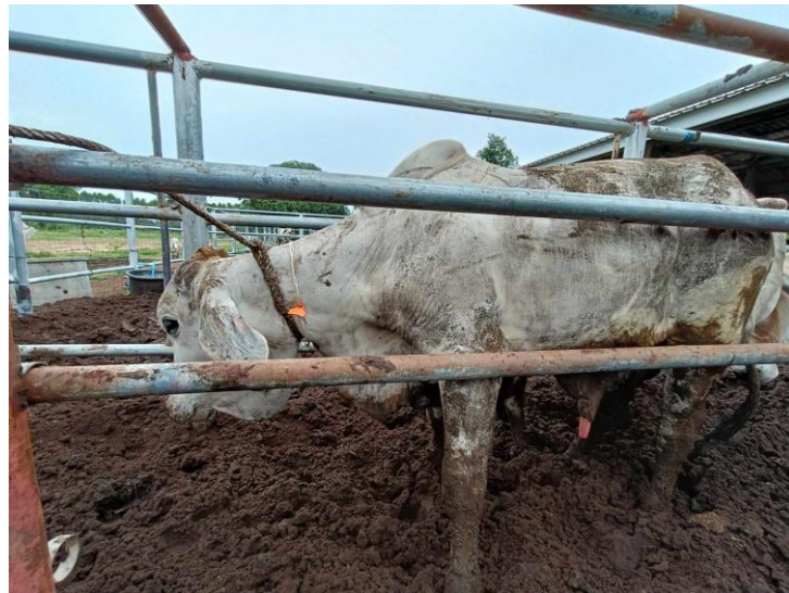
รูปที่ 20 โคหมายเลข 53938 พันธุ์พื้นเมือง