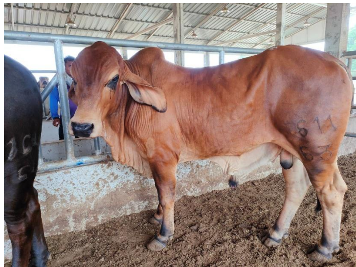
รูปที่ 23 โคหมายเลข 611-63 พันธุ์บราห์มัน