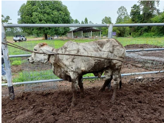
รูปที่ 1 โคหมายเลข 53986 พันธุ์พื้นเมือง

รายการจำหน่ายพัสดุ กรณีพัสดุชำรุด เสื่อมสภาพ หรือไม่จำเป็นต้องใช้งานในฟาร์มมหาวิทยาลัยมหาสารคาม จำนวน 30 รายการ(ปศุสัตว์)