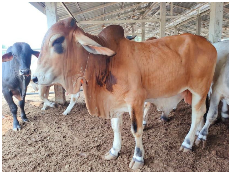
รูปที่ 27 โคหมายเลข 53944 พันธุ์พื้นเมือง