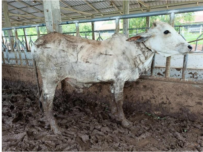
รูปที่ 7 โคหมายเลข 53940 พันธุ์พื้นเมือง