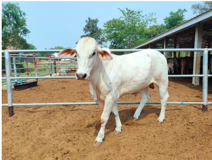
รูปที่ 26 โคหมายเลข 53943 พันธุ์พื้นเมือง