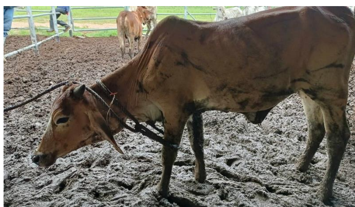
รูปที่ 6 โคหมายเลข 53998 พันธุ์พื้นเมือง