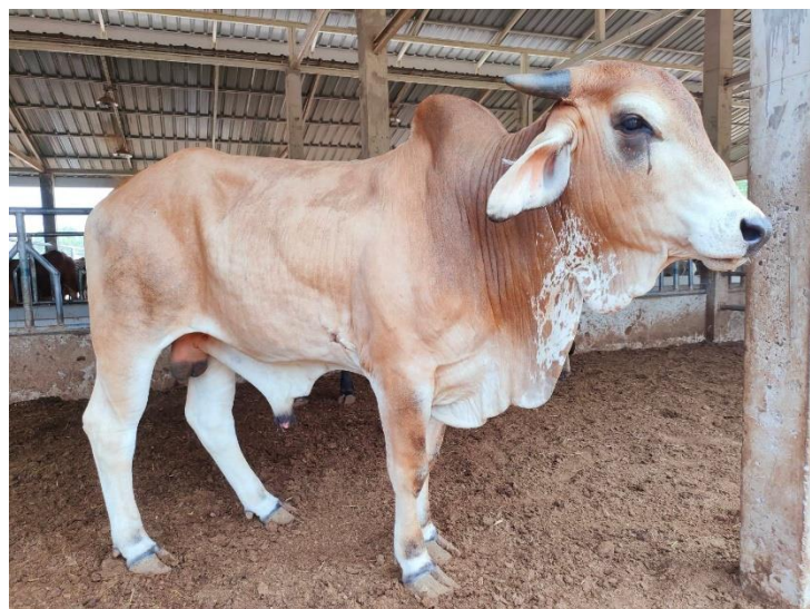
รูปที่ 24 โคหมายเลข 53941 พันธุ์พื้นเมือง