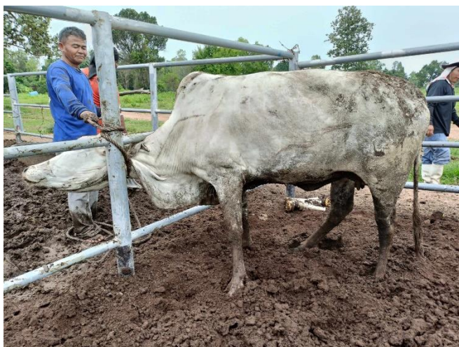
รูปที่ 3 โคหมายเลข 53995 พันธุ์พื้นเมือง