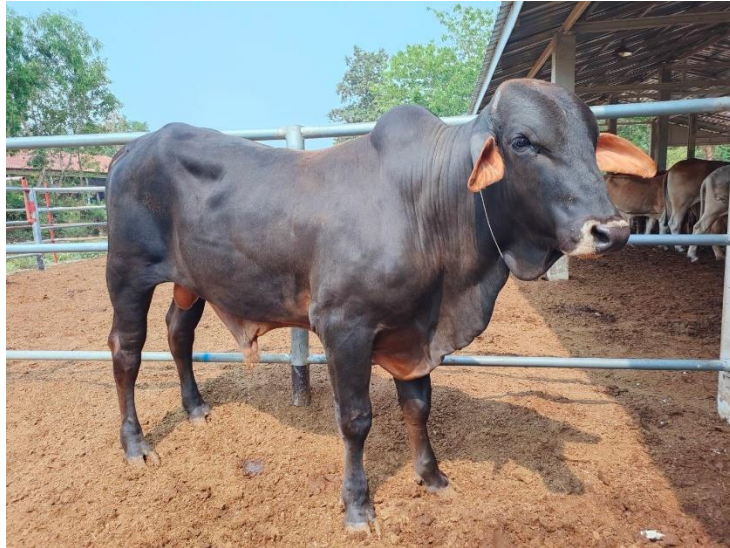
รูปที่ 28 โคหมายเลข 53945 พันธุ์พื้นเมือง