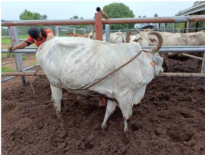
รูปที่ 15 โคหมายเลข 53932 พันธุ์พื้นเมือง