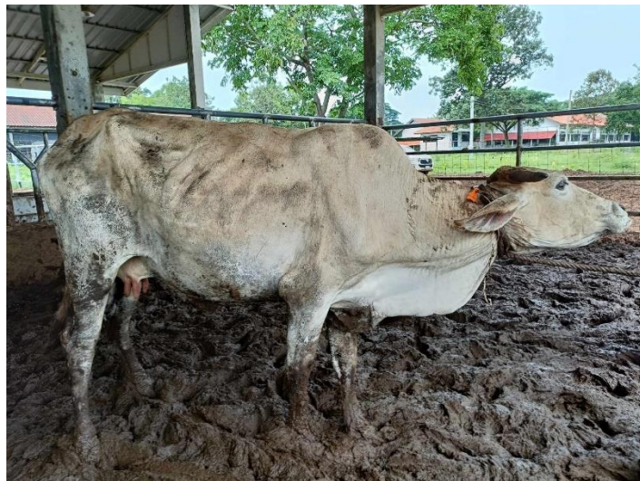
รูปที่ 9 โคหมายเลข 53949 พันธุ์พื้นเมือง