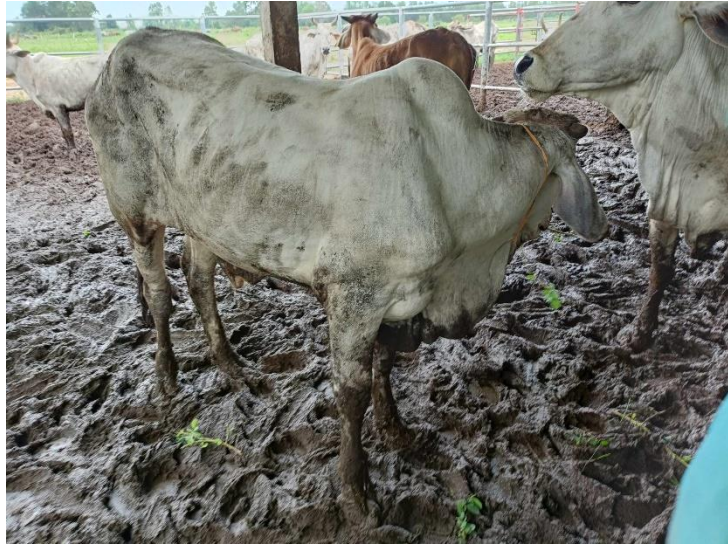
รูปที่ 22 โคหมายเลข 53999 พันธุ์พื้นเมือง