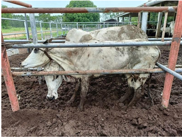
รูปที่ 8 โคหมายเลข 53997 พันธุ์พื้นเมือง