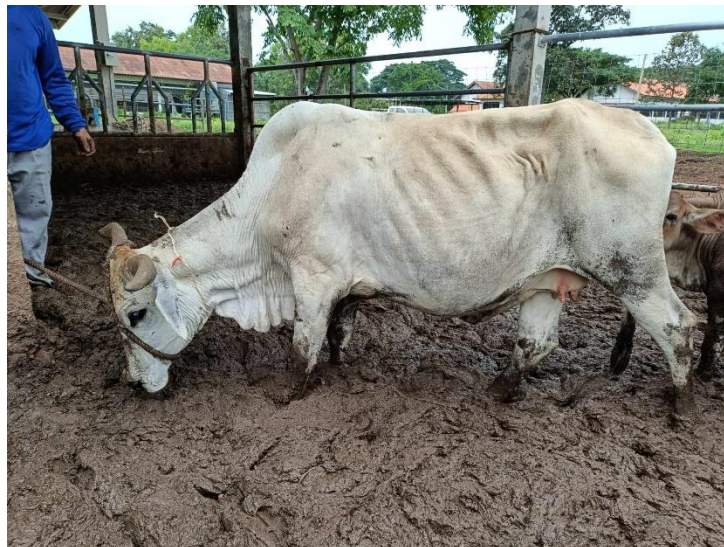
รูปที่ 12 โคหมายเลข 53993 พันธุ์พื้นเมือง