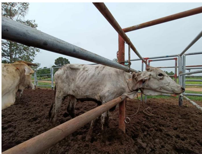
รูปที่ 4 โคหมายเลข 53994 พันธุ์พื้นเมือง