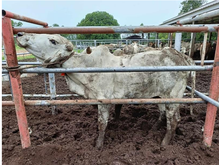
รูปที่ 10 โคหมายเลข 53936 พันธุ์พื้นเมือง