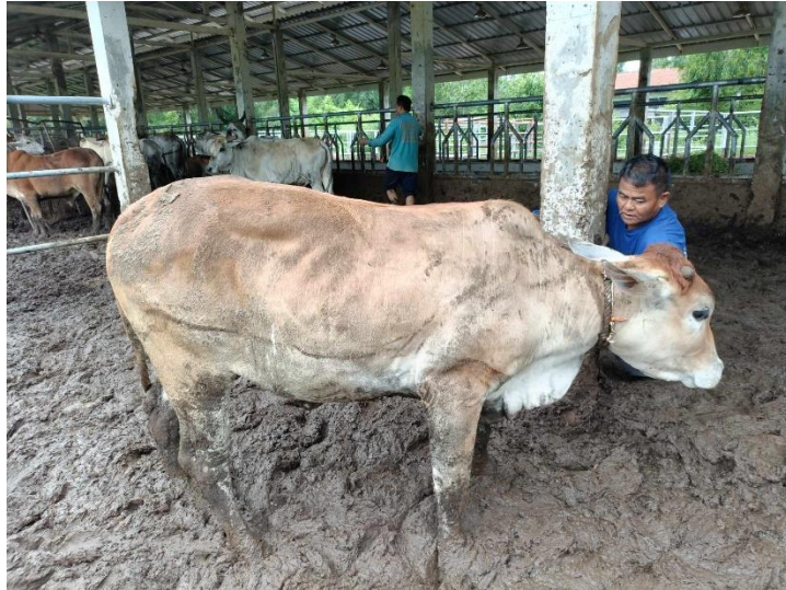
รูปที่ 13 โคหมายเลข 53992 พันธุ์พื้นเมือง