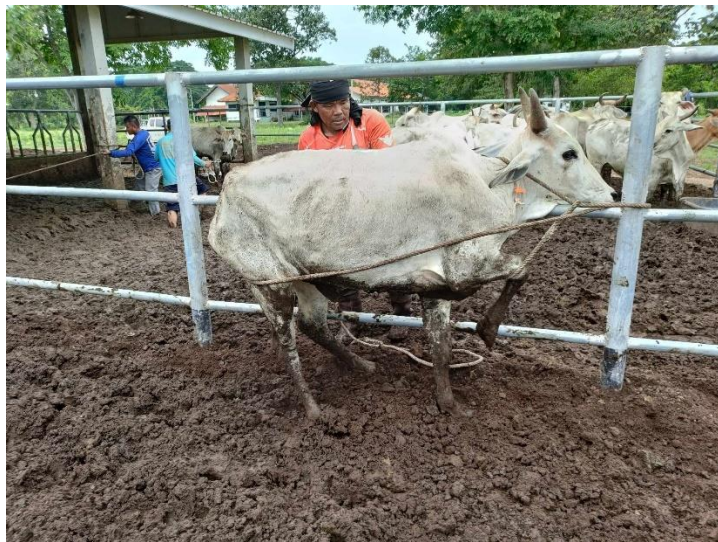
รูปที่ 14 โคหมายเลข 53935 พันธุ์พื้นเมือง