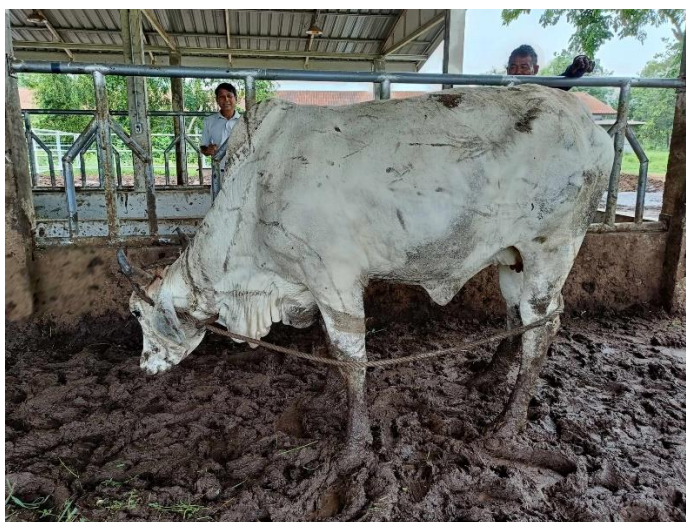
รูปที่ 5 โคหมายเลข 53939 พันธุ์พื้นเมือง