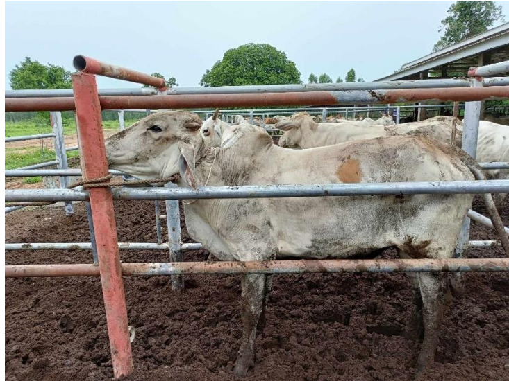
รูปที่ 16 โคหมายเลข 53950 พันธุ์พื้นเมือง