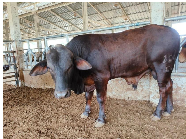
รูปที่ 30 โคหมายเลข 164-64 พันธุ์บาร์หมัน