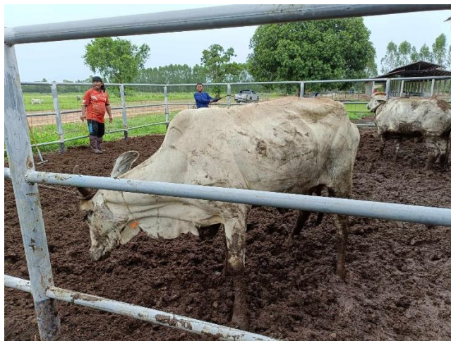
รูปที่ 2 โคหมายเลข 53990 พันธุ์พื้นเมือง