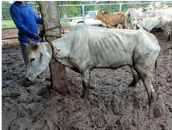
รูปที่ 11 โคหมายเลข 53947 พันธุ์พื้นเมือง