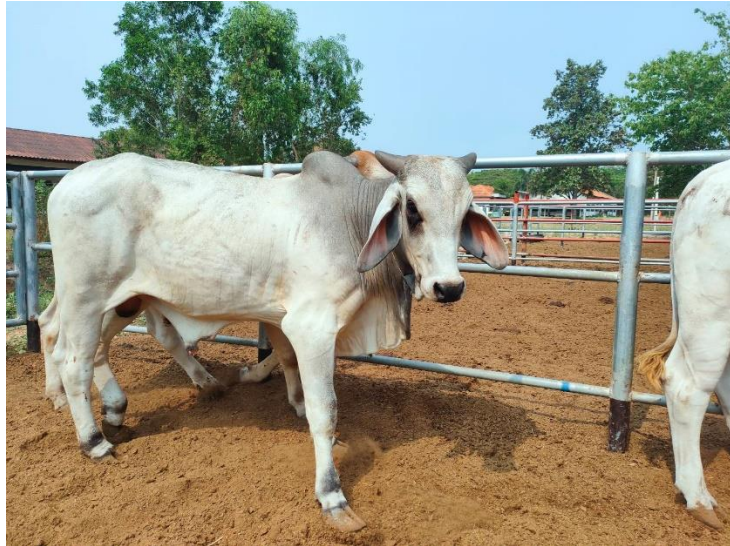
รูปที่ 25 โคหมายเลข 53942 พันธุ์พื้นเมือง