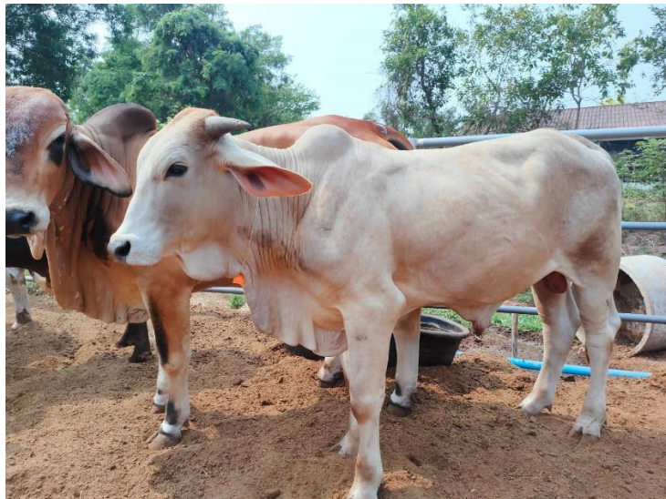
รูปที่ 29 โคหมายเลข 53946 พันธุ์พื้นเมือง