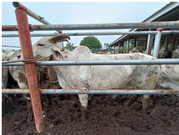
รูปที่ 18 โคหมายเลข 53933 พันธุ์พื้นเมือง