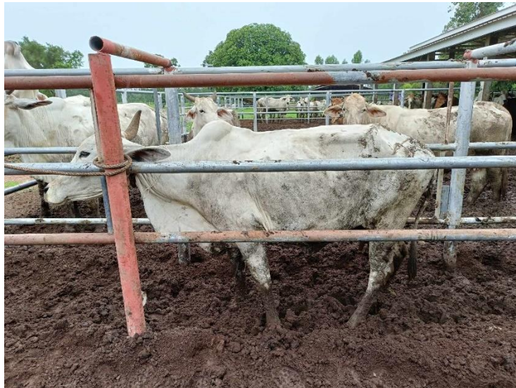
รูปที่ 17 โคหมายเลข 53948 พันธุ์พื้นเมือง