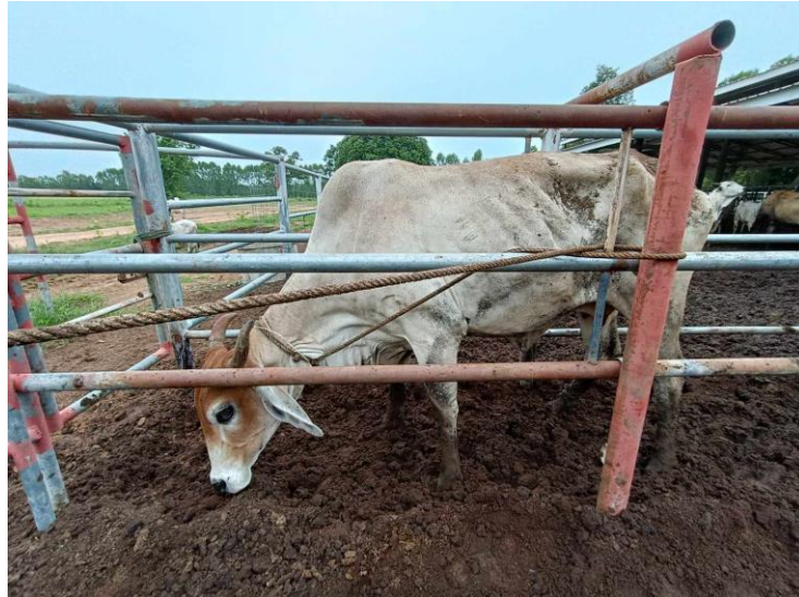
รูปที่ 19 โคหมายเลข 53931 พันธุ์พื้นเมือง